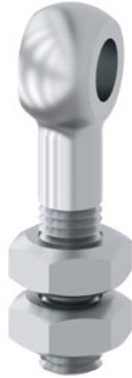
śruba z uchem M10 z nakrętką, ze stali