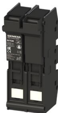
SITOR uchwyt bezpiecznika 22x 127 63 A 1500 V AC/DC 1000V 2-bieg.