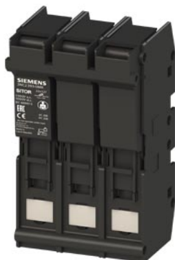
SITOR uchwyt bezpiecznika 22x 127 63 A 1500 V AC/DC 1000V 3-bieg.