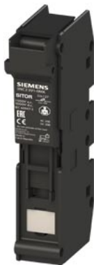
SITOR uchwyt bezpiecznika 22x 127 63 A 1500 V AC/DC 1000V 1-biegunowy