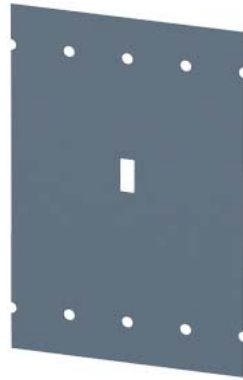
plyta izolacyjna DC akcesorium do: 3VA10/11 4P