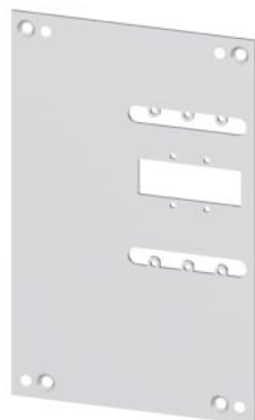
blokada tylna płyta montażowa akcesorium do: 3VA51