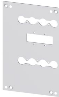
blokada tylna płyta montażowa akcesorium do: 3VA12