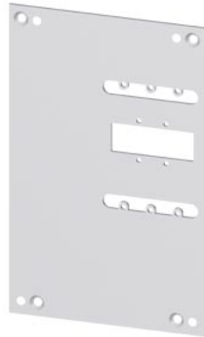
blokada tylna płyta montażowa akcesorium do: 3VA11