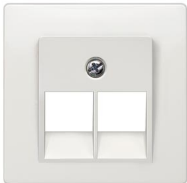
DELTA i-system biały tytanowy osłona UAE kat. 3, 2-krotn. 55x55mm