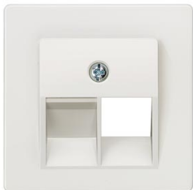
DELTA i-system biały tytanowy osłona UAE kat. 3, 1-krotn. 55x55mm