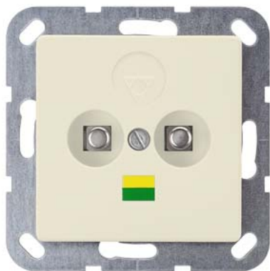
DELTA i-system biały kremowy podwójne gniazdo wyrównania potencjałów 55x55mm