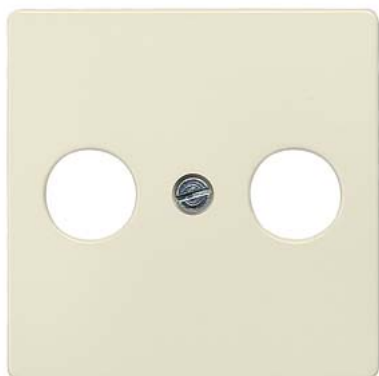
DELTA i-system biały kremowy płyta osłonowa TV/RF/SAT, 2-otw. 55x55mm