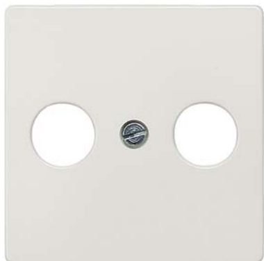
DELTA i-system biały tytanowy płyta osłonowa płyta osłonowa TV/RF/SAT, 2-otw. 55x55mm