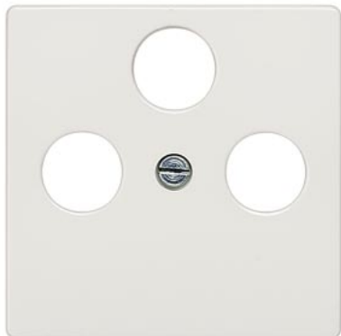
DELTA i-system biały tytanowy płyta osłonowa TV/RF/SAT, 3-otw. 55x55mm