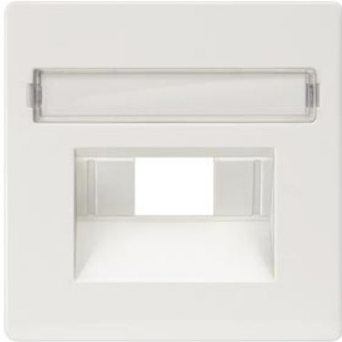
DELTA i-system biały tytanowy osłona UAE kat. 3, 1- i 2-krotn. pole tekstowe