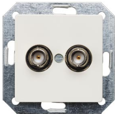
DELTA i-system biały tytanowy styk gniazdowy BNC 2-krotn. 75 Ohm 55x55mm