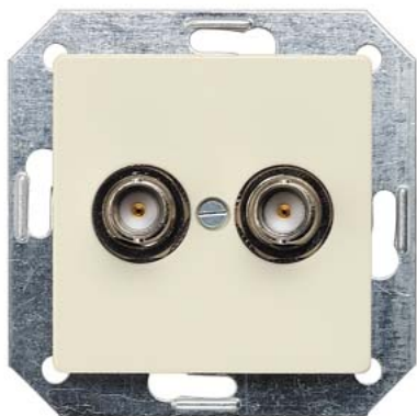
DELTA i-system biały kremowy styk gniazdowy BNC 2-krotn. 75 Ohm 55x55mm