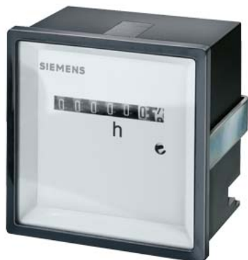
licznik czasu 72x 72 mm 115 V AC 60 Hz bez osłony zacisków