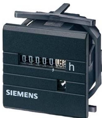
licznik czasu 48x 48 mm AC 230 V 60 Hz bez osłony 55x 55 mm