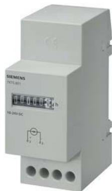
mechaniczny licznik impulsów 24 V, 50 Hz