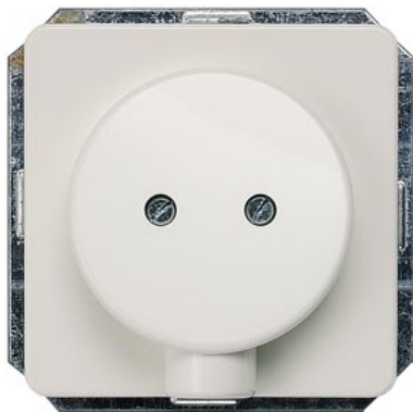
DELTA profil biały tytanowy płyta wylotowa