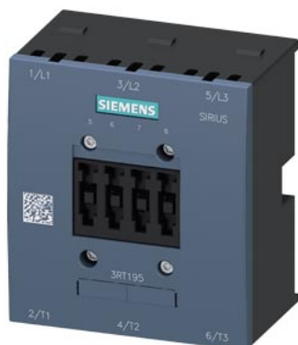
Komora łukowa do 3RT1055