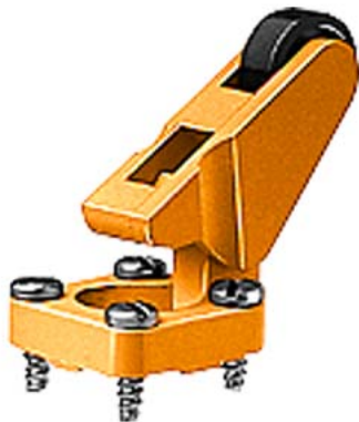
Napędy łączników drogowych 3SE55 (3SE200 i 3SE3210) Kątowa dźwignia rolkowa