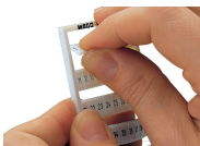
Lösen eines Streifens aus der WMB-Beschriftungskarte