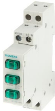
lampka sygnalizacyjna / fazowa 3x LED, 12..60 V zielony