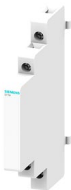
łącznik pomocniczy zestyk do AC 6 A, 250 V 1 NO 1 NC