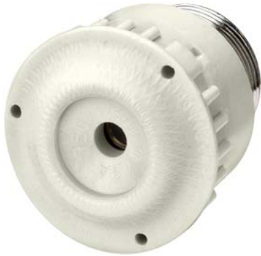
główka bezpiecznikowa DIAZED DIII 63 A AC DC 750 V ceramika do podstawy 5SF4230