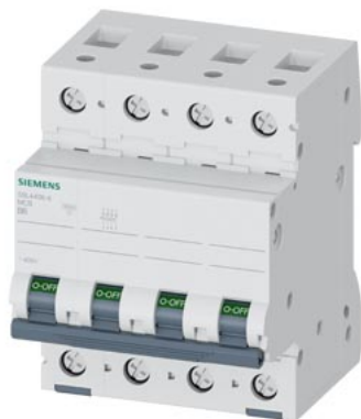
wyłącznik nadmiarowo-prądowy 400 V 10 kA, 4-bieg., B, 6 A