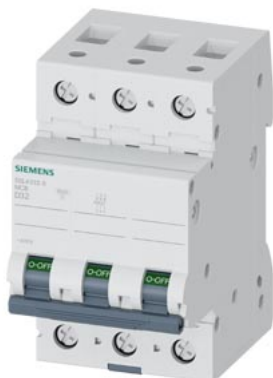
wyłącznik nadmiarowo-prądowy 400 V 10 kA, 3-bieg., D, 32 A