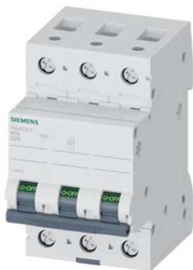
wyłącznik nadmiarowo-prądowy 400 V 10 kA, 3-bieg., D, 25 A