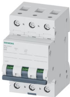
wyłącznik nadmiarowo-prądowy 400 V 10 kA, 3-bieg., B, 16 A