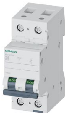
wyłącznik nadmiarowo-prądowy 400 V 10 kA, 2-bieg., D, 25 A