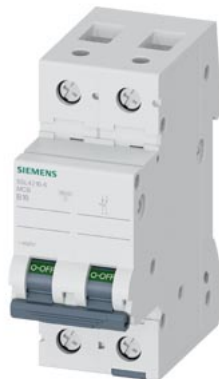
wyłącznik nadmiarowo-prądowy 400 V 10 kA, 2-bieg., B, 16 A