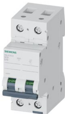
wyłącznik nadmiarowo-prądowy 400 V 10 kA, 2-bieg., D, 13 A