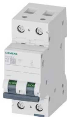
wyłącznik nadmiarowo-prądowy 400 V 6 kA, 2-bieg., B, 16 A