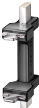
rozlacznik nożowy NH rozm. 2 zwora izolowana