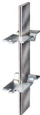
rozłącznik nożowy NH rozm. 4 A