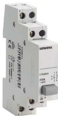
przycisk, 2 NO 20 A, 1 przycisk szary ryglowany