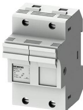
SENTRON, uchwyt bezpiecznika cylindrycznego, 14x51 mm, 2-bieg., In: 50 A, Un AC: 690 V