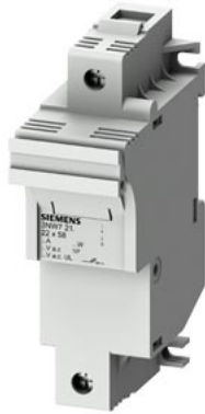
SENTRON, uchwyt bezpiecznika cylindrycznego, 22x58 mm, 1-bieg., In: 100 A, Un AC: 690 V, sygnalizator LED