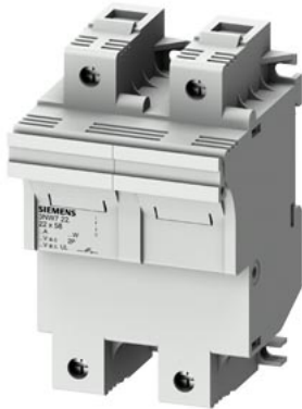
SENTRON, uchwyty bezpiecznika cylindrycznego, 22x58 mm, 2-bieg., In: 100 A, Un AC: 690 V