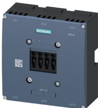
Komora łukowa do 3RT1075