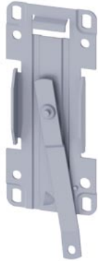
Aksesoria dla łącznika drogowego Płyta podstawy