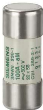
SENTRON, bezpiecznik cylindryczny, 22x58 mm, 32 A, aM, Un AC: 690 V