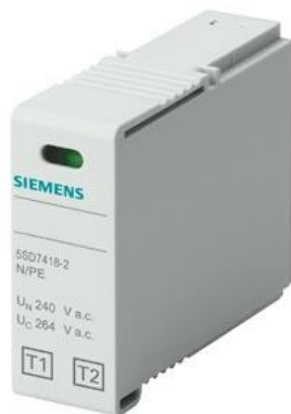
wtyczka T1/T2 dla 5SD7483-6 i 5SD7483-7