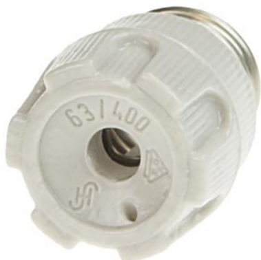
główka bezpiecznikowa NEOZED porcelana rozmiar D02, 63 A