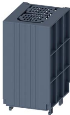
osłona zacisków SENTRON do 3KF4