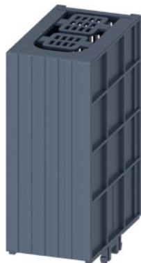
osłona zacisków SENTRON do 3KF2