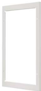
SIMBOX 63 ramka pośrednia 2-R do urządzeń 70 mm w rozdzielnicy N