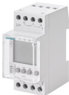
tygodniowy zegar sterujący Profi Digital 24 V 16 A 2-kanalowy 2 DU